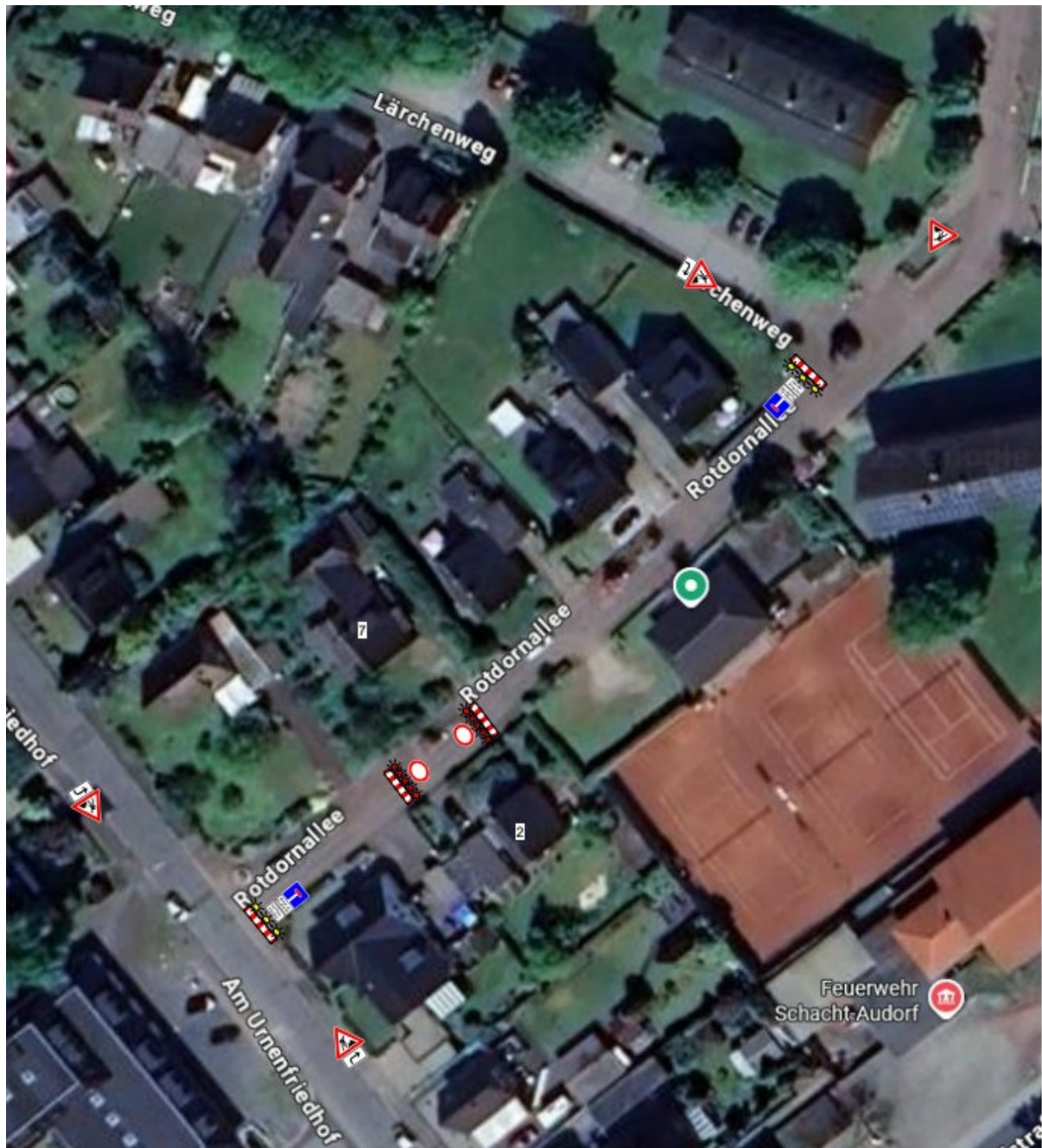
Vollsperrung Rotdornallee, Schacht-Audorf