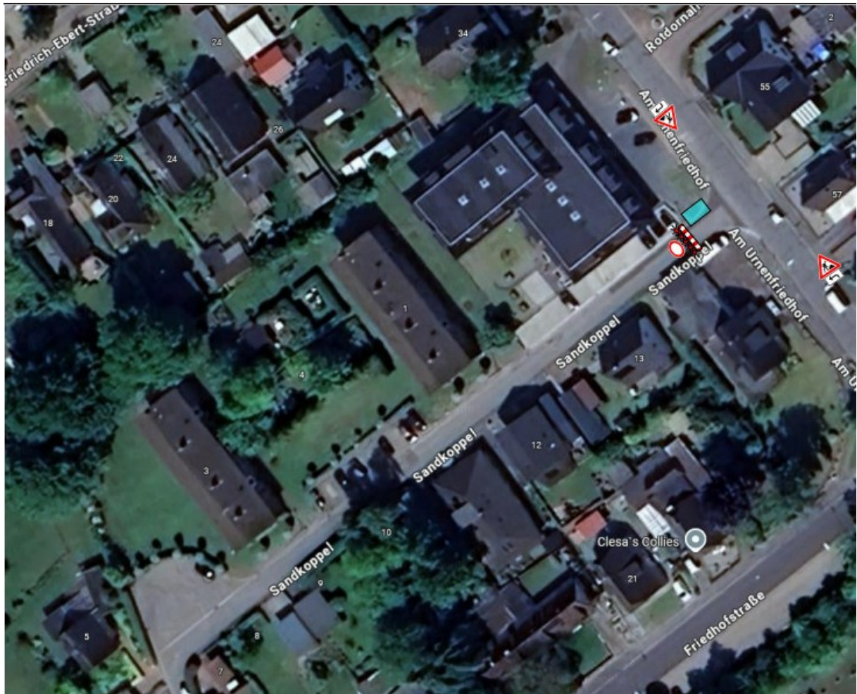
Vollsperrung Sandkoppel, Schacht-Audorf