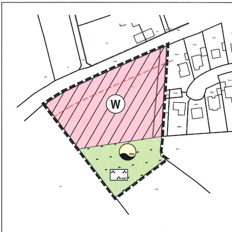
Darstellung der 20. Änderung des Flächennutzungsplanes

Anbauverbotszone L47 (20 m) § 29 Abs. 1 StrWG-SH