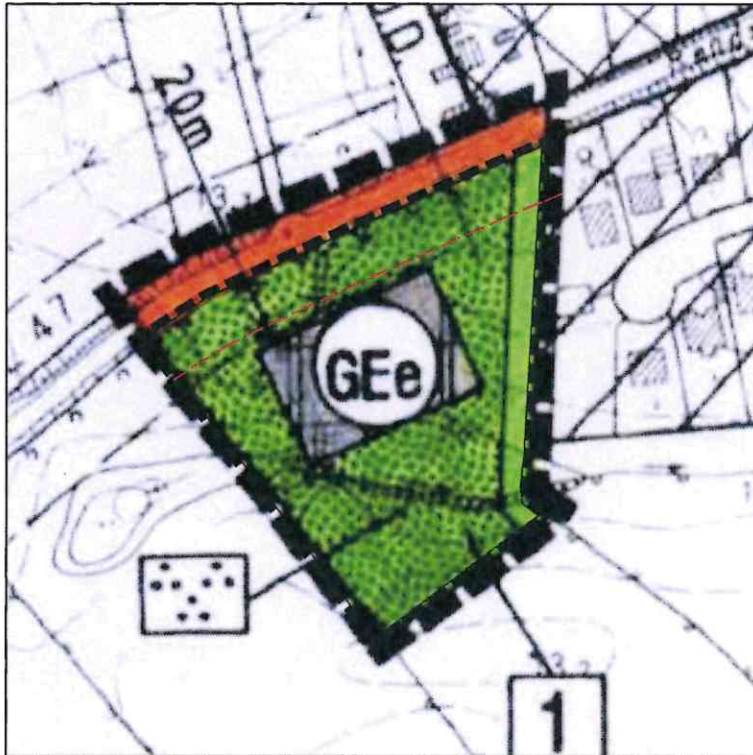
Ausschnitt des bis dato wirksamen Flächennutzungsplanes (Stand für den Plangeltungsbereich: 7. Änderung, 2002)