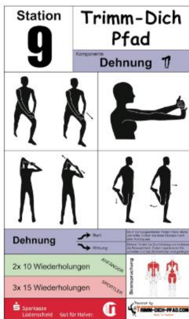
Abbildung 10: Hinweisschild (Outgym)

Die verschiedenen Hersteller bieten insbesondere für Senioren Geräte an, die zur Beweglichkeitssteigerung genutzt werden können. Unter dem Aspekt, verschiedene Zielgruppen anzusprechen, wird allerdings von der Vorstellung einzelner Geräte abgesehen und stattdessen die Empfehlung abgegeben, kostengünstigere Stationsschilder mit verschiedensten Dehn- und Beweglichkeitsübungen zu installieren – sinnvollerweise an einem potentiellen Startpunkt des Wanderweges (siehe Abbildung 10), sodass diese zugleich als Aufwärmprogramm durchlaufen werden können.