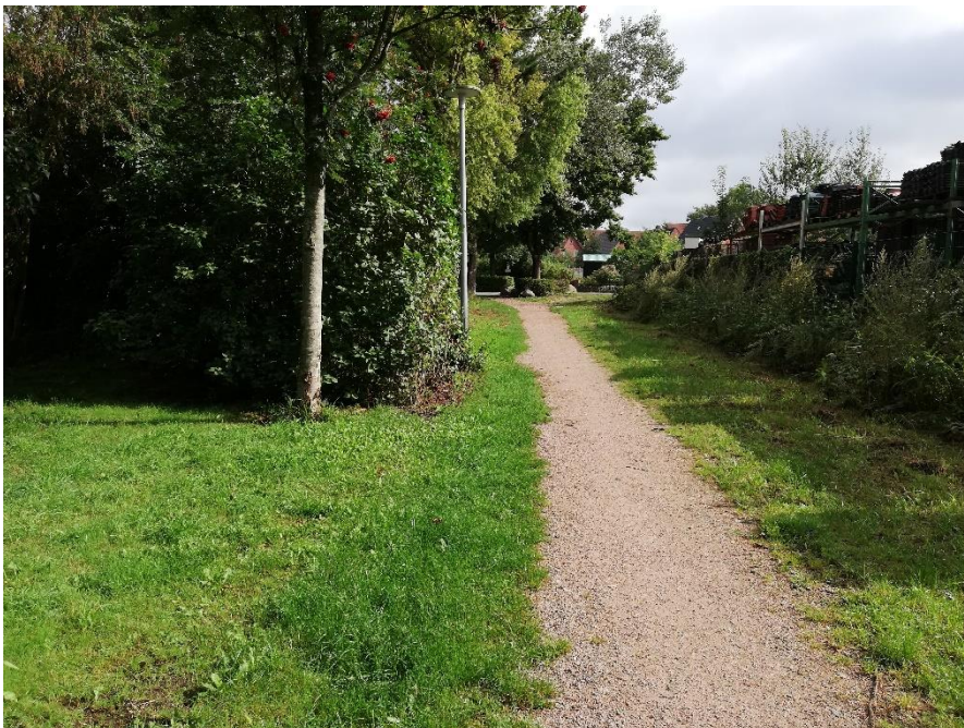
Abbildung 4: Teilstück zwischen Dorfstraße und Am Urnenfriedhof (Blick Richtung Am Urnenfriedhof)