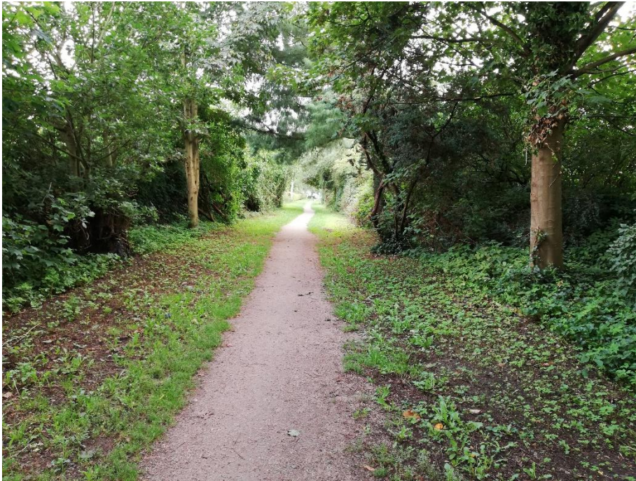
Abbildung 3: Teilstück zwischen Dorfstraße und Am Urnenfriedhof (Blick Richtung Dorfstraße)