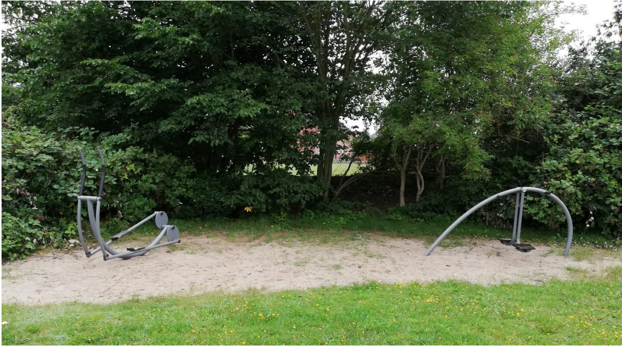
Abbildung 5: Der Crosstrainer und die Hip-Station

Das rechte Gerät - die Hip-Station – stärkt die Hüft- und Rumpfmuskulatur und verbessert zugleich die kardiovaskuläre Ausdauer. Hier können sogar zwei Sportler gleichzeitig aktiv sein.