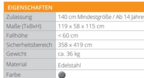
Abbildung 6: Die Ruderbank INOX (Freisport Outdoor Fitness)

Die Ruderbank INOX vom Hersteller Freisport Outdoor Fitness (siehe Abbildung 6) kann als ein Beispiel dafür herangezogen werden. Ähnliche Produkte finden sich bei nahezu allen Anbietern. Ein weiteres Gerät, das sich vielseitig einsetzen lässt und somit verschiedene Zielgruppen erreicht, ist die Kletterbrücke (siehe Abbildung 7). Dieses, recht einfach gehaltene, Gerät eignet sich für Dehnübungen, Krafttraining und Gymnastikübungen und trainiert umfassend alle Körperpartien.