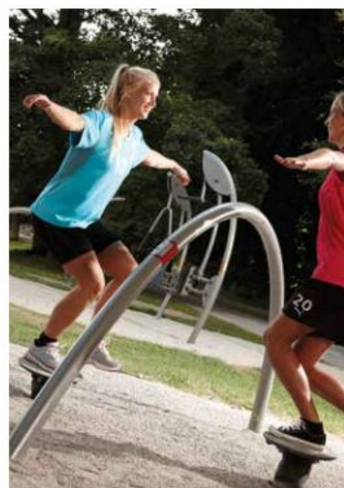
Abbildung 9: Springer-Station (Norwell Outdoor Fitness)