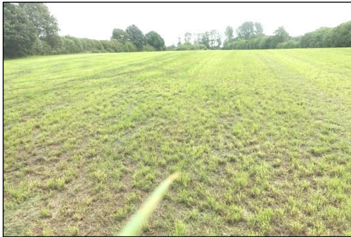
Abbildung 4: Südliche Teilfläche, frisch gemäht