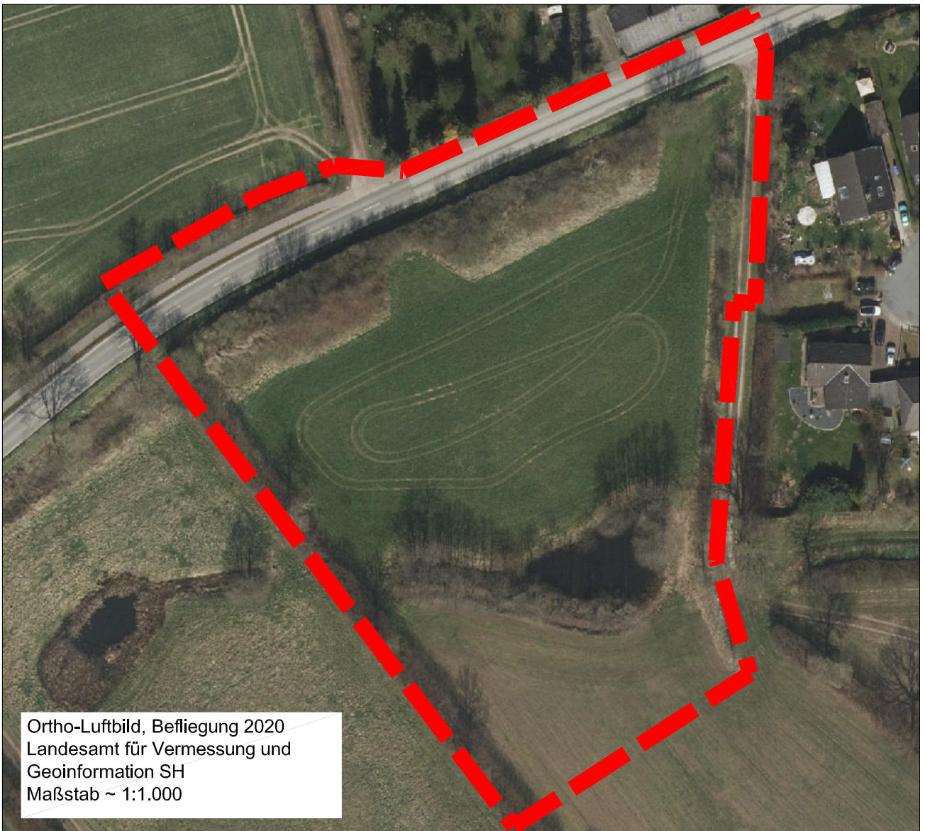
Ortho-Luftbild, Befliegung 2020 Landesamt für Vermessung und Geoinformation SH Maßstab ~ 1:1.000