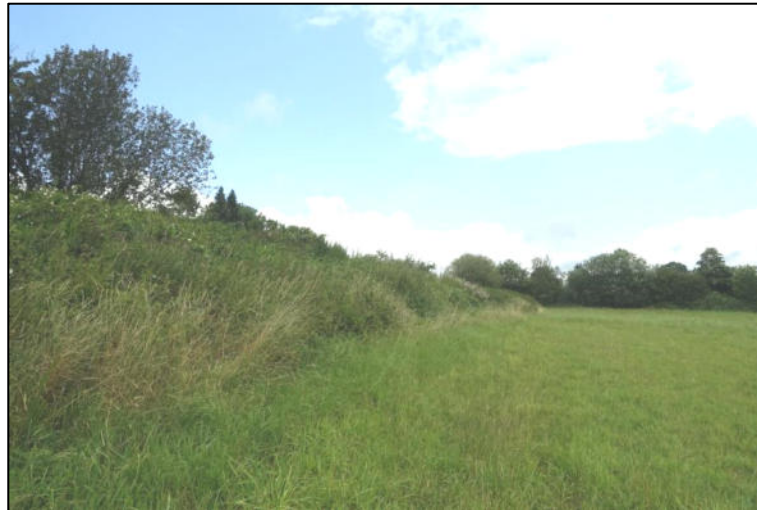
Abbildung 2: Wall, mit Ruderalvegetation

Die zentralen Flächen unterliegen einer landwirtschaftlichen Nutzung als Grünland. Es dominieren Gräser (Weiches Honiggras Holcus lanatus , Weidelgras Lolium perenne , Glatthafer Arrhenatherum elatius , Wiesenrispe Poa pratensis ). Kräuter sind in der Narbe so gut wie nicht vertreten. Vereinzelt kommen Wiesenkerbel ( Antriskus sylvestris ) und Stumpflättrigem Ampfer ( Rumex obtusifolius ) vor. Kleinräumig breitet sich Ackerkratzdistel ( Cirsium arvense ) aus. Die Teilfläche südlich des Regenrückhaltebeckens war zum Zeitpunkt der Begehung (August 2021) frisch gemäht.