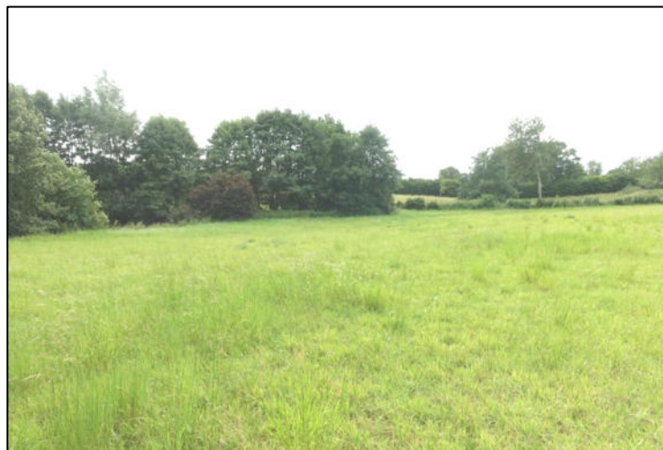
Abbildung 3: Blick über die nördliche Teilfläche nach Südwesten, im Hintergrund das Gehölzstandene RHB und der südwestlich verlaufende Grenznick

Die zentralen Flächen unterliegen einer landwirtschaftlichen Nutzung als Grünland. Es dominieren Gräser (Weiches Honiggras Holcus lanatus , Weidelgras Lolium perenne , Glatthafer Arrhenatherum elatius , Wiesenrispe Poa pratensis ). Kräuter sind in der Narbe so gut wie nicht vertreten. Vereinzelt kommen Wiesenkerbel ( Antriskus sylvestris ) und Stumpflättrigem Ampfer ( Rumex obtusifolius ) vor. Kleinräumig breitet sich Ackerkratzdistel ( Cirsium arvense ) aus. Die Teilfläche südlich des Regenrückhaltebeckens war zum Zeitpunkt der Begehung (August 2021) frisch gemäht.