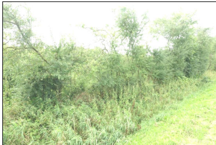
Abbildung 1: Straßenbegleitgrün

Auf der Südseite der Straße hat sich auf der Böschungsoberkante des Straßenbegleitenden Grabens ein Gehölzbestand entwickelt. Charakter und Funktion eines Knicks sind hier aber nicht gegeben. Es handelt sich um von spontanem Gehölzaufwuchs geprägtes Straßenbegleitgrün.