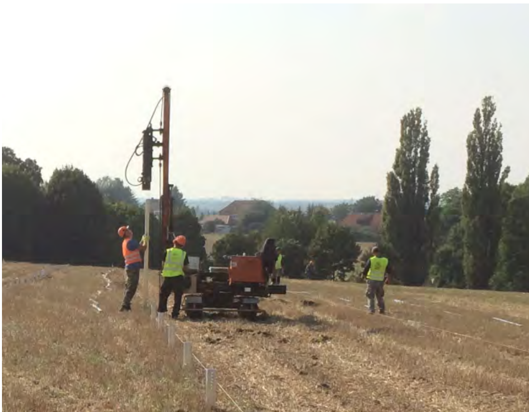
Abbildung 1.1 Beispieldarstellung Rammung

Die Module werden parallel in Ost-/Westausrichtung mittels Metallkonstruktion mit fest definiertem Winkel zur Sonne nach Süden hin aufgeständert. Die Module werden auf so genannten „Tischen“ angeordnet, welche mittels Metallpfosten ohne Fundament im Boden verankert sind.